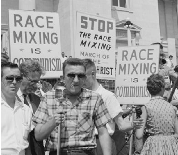
წარწერა პლაკატებზე: „რასების აღრევა კომუნიზმია“. „შეწყვიტეთ რასების აღრევა - ანტიქრისტეს სვლა.“ აშშ, ლითლ- როკი, 1959 წელი