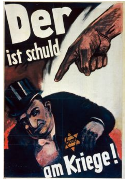
ნაცისტური ანტიებრაული პროპაგანდის ნიმუში. წარწერა: „ის არის ომში დამნაშავე!“