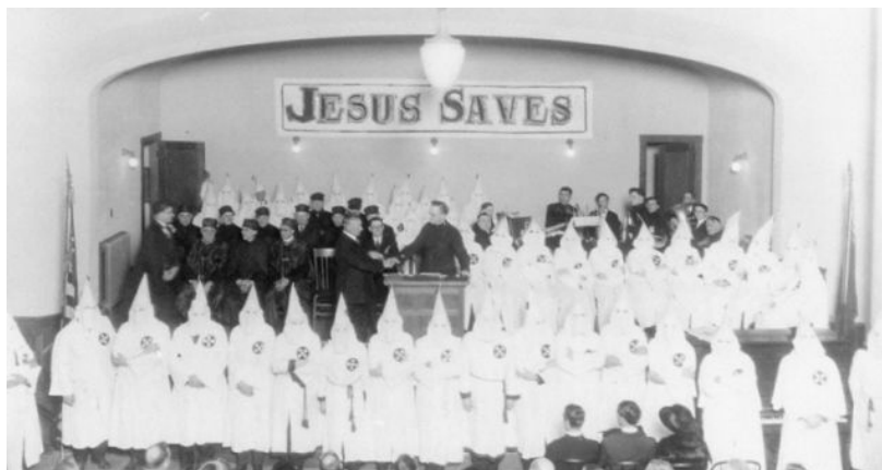
რასისტული ტერორისტული ორგანიზაცია „კუ-კლუქს-კლანის“ შეხვედრა. წარწერა კედელზე: „იესო გადაგვარჩენს“.