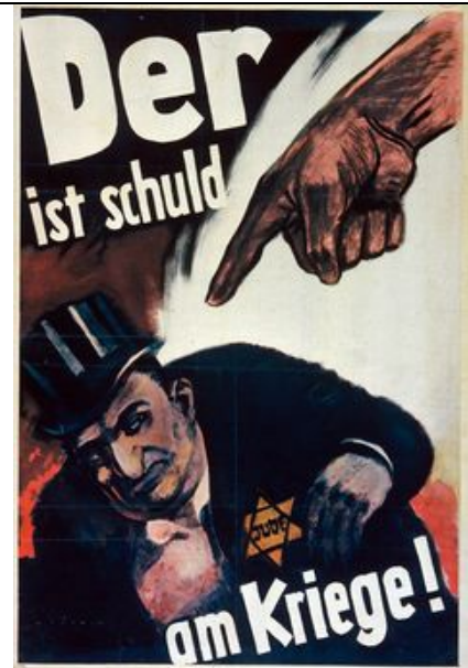
Образец нацистской антиеврейской пропаганды. Надпись: «Он – зачинщик войны!»