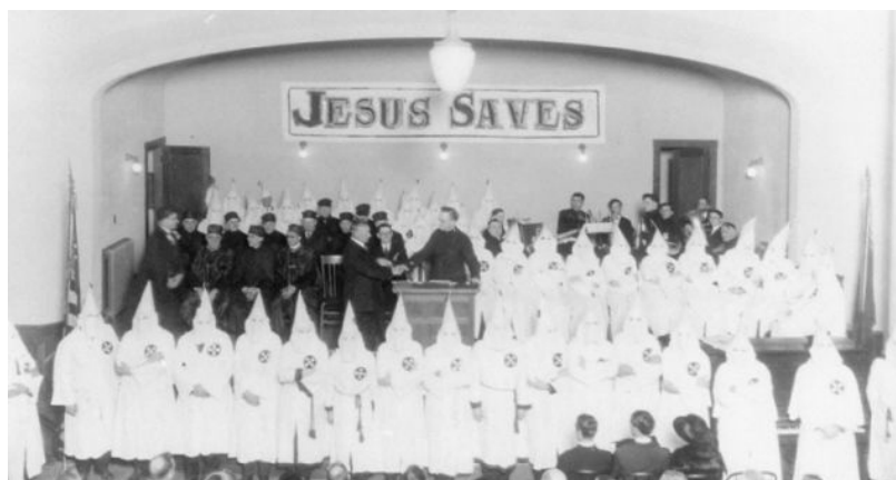
Встреча расистской террористической организации «Ку-клукс-клана». Надпись на стене: «Иисус спасет нас».