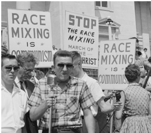
Надпись на плакатах: «Смешение рас – это коммунизм». "Остановить смешение рас - приход антихриста." США, Little Rock, 1959